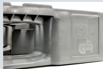
Sprawdzone i certyfikowane bezpieczeństwo