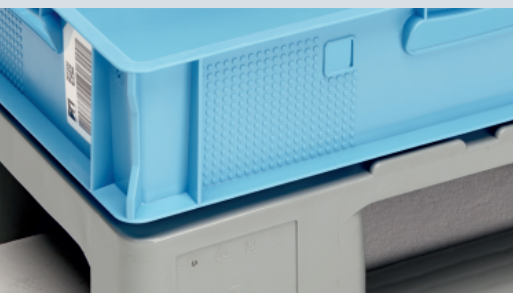
Kompatybilna z pojemnikami E i F Performance oraz innymi formatami pojemników w branży spożywczej

Idealnie dopasowana do wymogów w przemyśle spożywczym