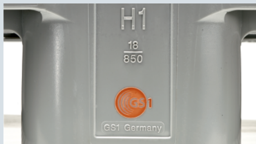
Możliwe indywidualne znakowanie