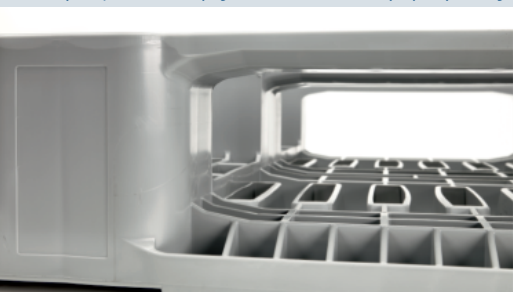
Ekstremalnie wytrzymała, o stabilnej konstrukcji