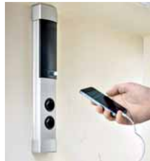
Die neue Naber „Muzak“-Säule kombiniert Steckdosen und Lautsprecher mit Bluetooth-Schnittstelle und USB-Ladestation in einem ansprechenden Element.