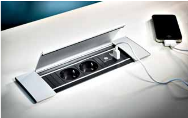
Das Naber Produkt „Power Frame Cover-USB“ zum Einkleben in die Arbeitsplatte bietet neben Steckdosen zwei USB-Ladestationen.

Wer neue Wege der ePower-Konnektivität sucht, wird im Naber Küchenzubehör-Gesamtkatalog 2015/2016 oder unter www.naber.de fündig. ■