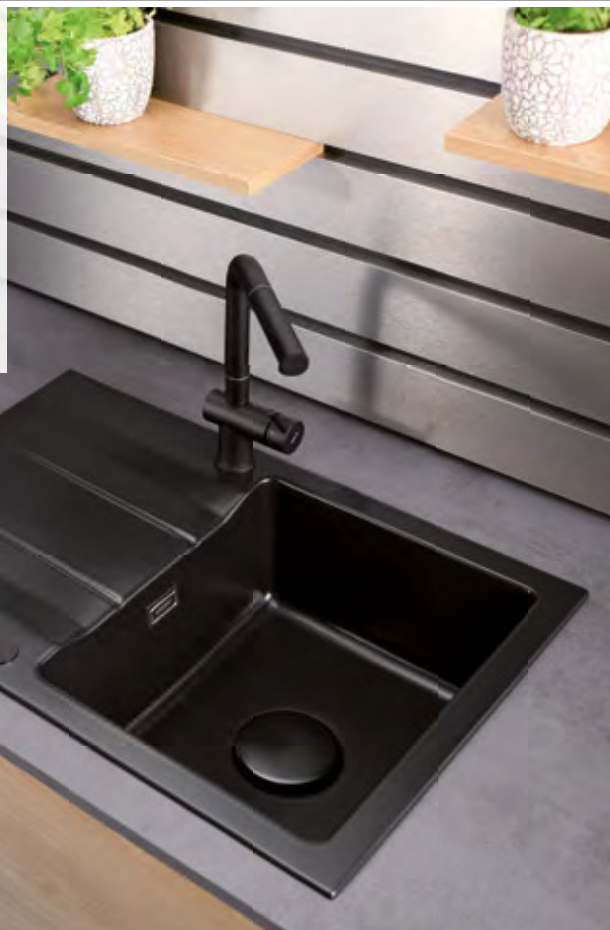
GENEA 75 in Nigra mit Armatur LIVE, Drehexcenter und vollkeramischem Sinktop-Cover.

Im samtmattem Schwarz werden selbst profane Dinge wie eine Armatur, ein Seifenspender oder eine Rollmatte zum selbstbewussten Statement.