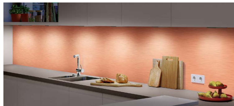
Blickfang Nische: z. B. mit der kupferfarbenen Alu-Oberfläche SPAZZOLATO