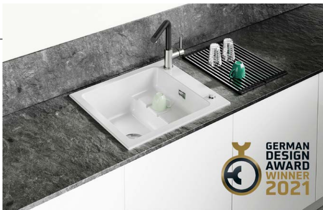
PickUP, die neue, hochwertige Keramikspülen-Serie mit integrierter Ablagefläche

Bei der Corno Turno lässt sich die integrierte Armatur beidseitig um 90 Grad im Becken versenken. Design by tbSTUDIO, Berlin