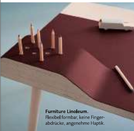
Furniture Linoleum. Flexibel formbar, keine Fingerabdrücke, angenehme Haptik.