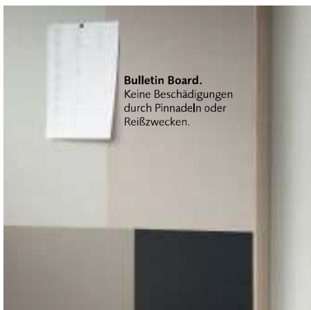
Bulletin Board. Keine Beschädigungen durch Pinnadeln oder Reißzwecken.