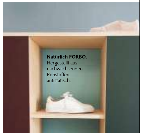
Natürlich FORBO. Hergestellt aus nachwachsenden Rohstoffen, antistatisch.