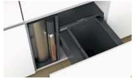
Neu bei Naber: Abfallsammler, die neben dem Kochendwasser-Reservoir Platz finden.

Möbelkorpus beispielsweise nehmen bis zu drei Behälter insgesamt 42 Liter Wertstoffe, Bioabfälle und Restmüll für die Entsorgung oder Wiederverwertung auf.