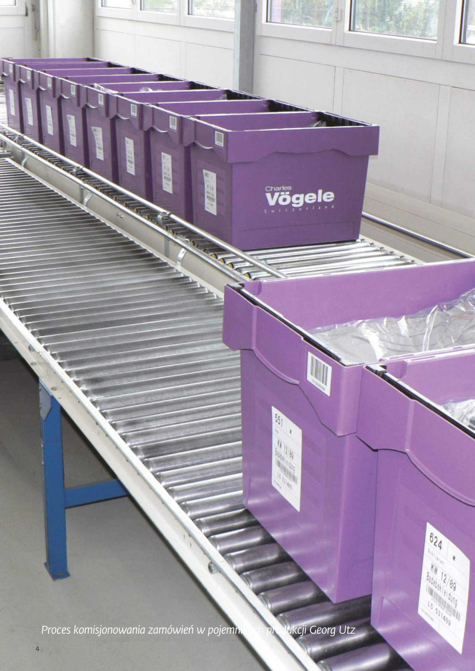
Proces komisjonowania zamówień w pojemnikach produkcji Georg Utz