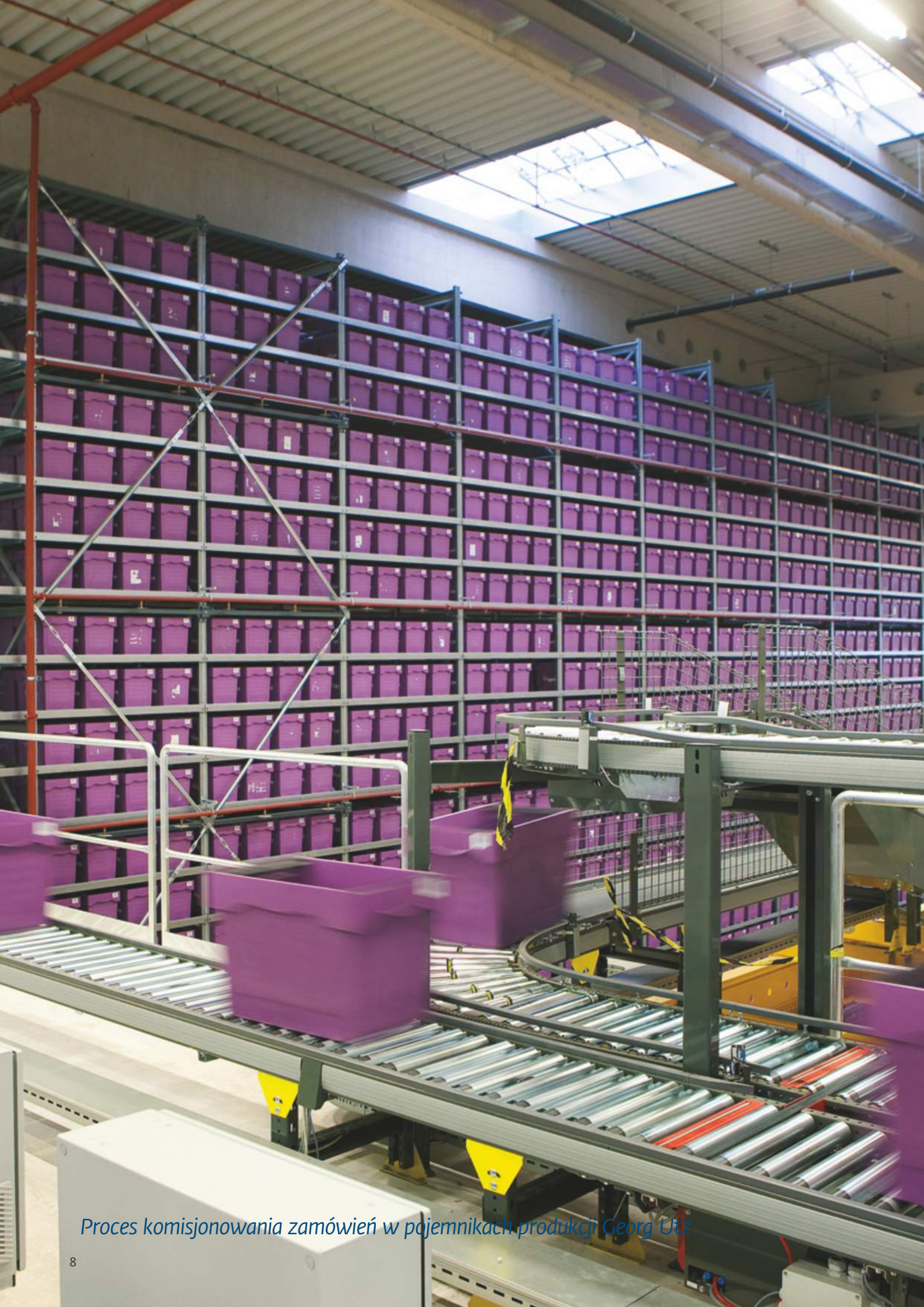
Proces komisjonowania zamówień w pojemnikach produkcji Georg Utz